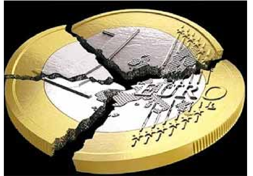
Aðeins 18 af 28 ríkjum ESB eru með evru. Í reynd er Evrópusambandið þegar klofið í tvo hluta.

Í Bretlandi er ört vaxandi andstaða við sambandsríkjaþróun ESB. Bretland er ekki með evru og ekki heldur önnur nágrannaríki Íslands s.s. Danmörk og Svíþjóð.