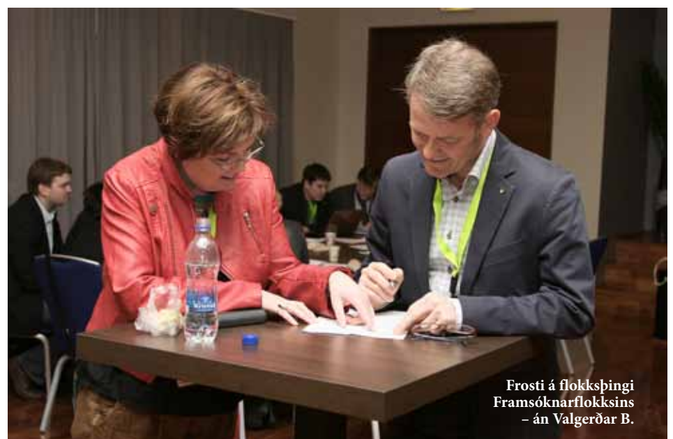
Frosti á flokksþingi Framsóknarflokksins – án Valgerðar B.

Hefði ekki verið betra að spyrja þjóðina áhlits áður en hafist var handa við að aðlaga Ísland að Evrópusambandinu?