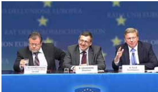
Füle útskýrir ómöguleika fyrir Össuri.

Össur skilur það hvorki á íslensku né útlensku að 300 þúsund manna þjóð fær hvorki varanlegar undanþágur né marktækar