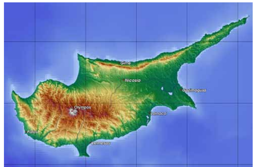
Evrópusambandið kleip af bankareikningum Kýpverja til að bjarga bankakerfinu og til viðbótar eru vextir allt lífandi að drepa - þó er Kýpur með evru.